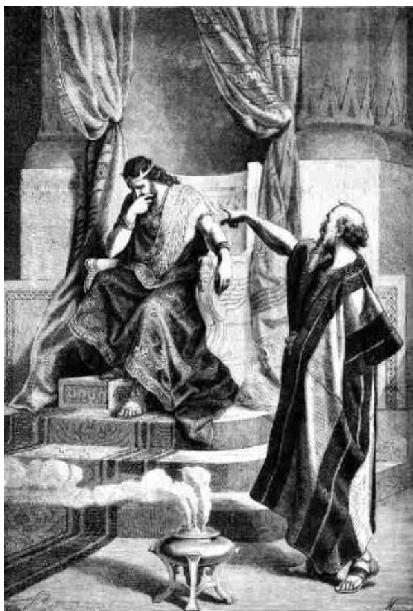
Jahve sänder Natan till att fördöma kung David: "Så säger HERREN: Se, jag skall låta olyckor komma över dig från ditt eget hus" (2. Sam. 12).

Här har vi nu hela det sammanhang som vi känner igen från Sumer och Babylon: en konung befäster sin ställning med gudomlig hjälp och bygger sin muromgärdade stad som säte för sig själv, sin administration och sin gud. Kungamakt och stadskultur hör alltså nära ihop och sanktioneras s a s uppifrån. Det sakrala kungadömet är den ideologi med religiösa övertoner som legitimerar makten.