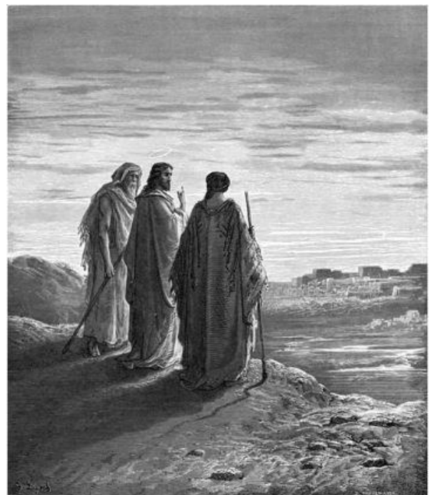
"Guds folk statt på vandring." Jesus och två lärjungar möts på vägen till Emmaus (Luk. 24).

När påven Johannes XXIII och Andra Vatikankonciliet försökte förändra den intill självklarhet etablerade synen på kyrkan som en exklusiv frälsnings- och salighetsinstitution med sanningsmonopol genom att i stället se kyrkan som "ett Guds folk statt på vandring", inte genom öknen utan genom världen och historien, då såg jag det som ett helt genialt drag som gav möjlighet till förnyelse av kyrkan. Det skulle kunnat innebära kyrkans återvändande till "äktjehvistisk" tradition, till självrannsakan och revision. Templet skulle symboliskt sett kunna ersättas av tältet! Den gången häpnade jag över den katolska kyrkans radikala utveckling och övervägde faktiskt att konvertera. Men som bekant har nästan alla Andra Vatikankonciliet beslut och resultat omintetgjorts genom hårdnackat motstånd från konservativa krafter.