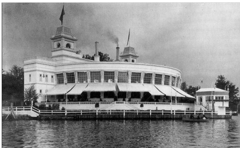
Restaurang Bispen, ritad av Ferdinand Boberg 1909, fick sitt namn efter sin belägenhet, på Biskopsudden.

– och Dagens Nyheter s påtryckning ytterst effektiv. Bispen (idag riven) var huvudrestaurangen vid 1909 års Konstindustriutställning. Just den kväll blomsterförsäljerskan skulle uppträda där väntades besök av kungligheterna.